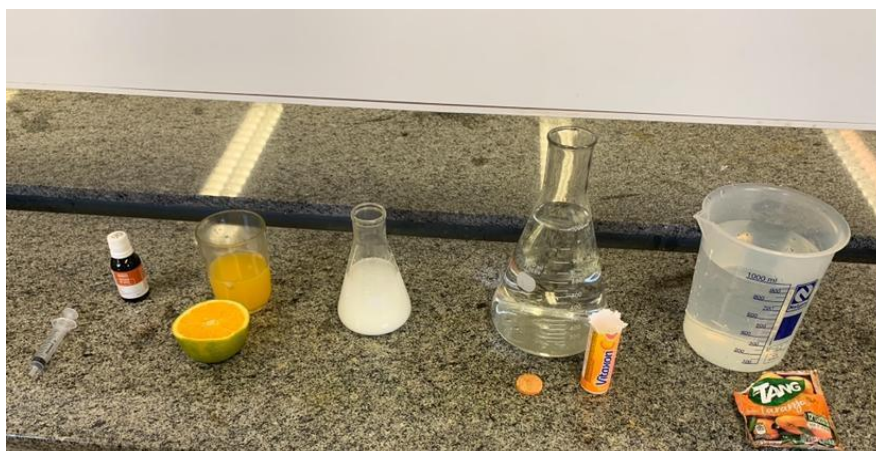
Figura 2: Materiais utilizados na aula experimental da IP6.

Salientamos que esse experimento foi planejado intencionalmente observando suas características visuais devido à necessidade de se explorar estratégias com o uso da imagética, signos e simbologias que oferecessem ao aluno surdo um olhar diferenciado da realidade,