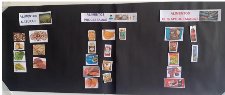
Figura 1: Painel construído pelos alunos sem auxílio dos professores: alimentos naturais, processados e ultra processados.

O painel foi dividido em três partes, conforme a classificação dos alimentos (naturais, processados e ultraprocessados), e aos alunos foram entregues imagens de alimentos que deveriam ser distribuídas de acordo com sua classificação, porém sem o auxílio do professor. A partir dessa atividade foi possível identificar as dificuldades de compreensão dos conceitos propiciando, então, a discussão e o esclarecimento de dúvidas.