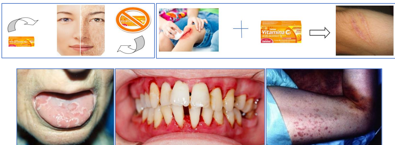
Figura 3: Imagens utilizadas durante a IP5

No extrato 2 é possível analisar como os recursos imagéticos utilizados (Figura 3) potencializaram a discussão sobre os benefícios da vitamina C para o nosso corpo.