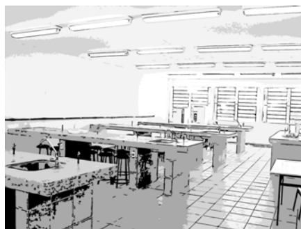
Figura 2. Laboratório de Química