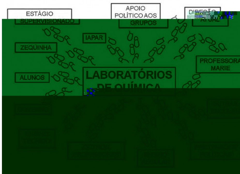
Figura 3. O fluxo do laboratório de Química

A Figura 3 retrata parte dos mecanismos de mobilização coletiva em torno do laboratório. Como podemos observar, muitos humanos e não-humanos estiveram conectados e foram agenciados pela professora Marie no processo de construção deste local de produção da ciência – o laboratório de Química. Visto que esta construção é coletiva, todos, em maior ou menor grau, deixaram sua contribuição e mostraram como “cada um é tão necessário quanto qualquer outro (Latour, 2000, p. 195) neste processo.