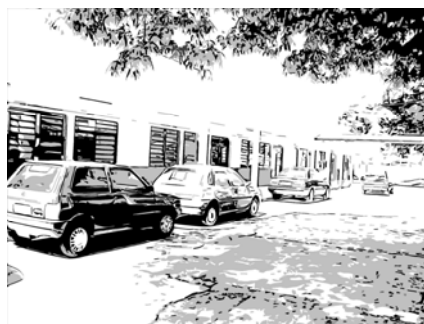
Figura 1. Novo bloco dos laboratórios

O PROEM articulou-se a uma relação direta com os interesses do mercado econômico mundial de protecionismo do capital e esteve pautado nos princípios da equidade, eficiência e eficácia , conceitos estes considerados fundamentais à melhoria da qualidade do ensino e ligados às idéias neoliberais (flexibilização, desregulamentação, descentralização, gestão compartilhada, autonomia da escola, entre outros) impostas pelos organismos financiadores dos projetos educacionais no país e adotadas pelo governo federal na administração do presidente Fernando Henrique Cardoso.