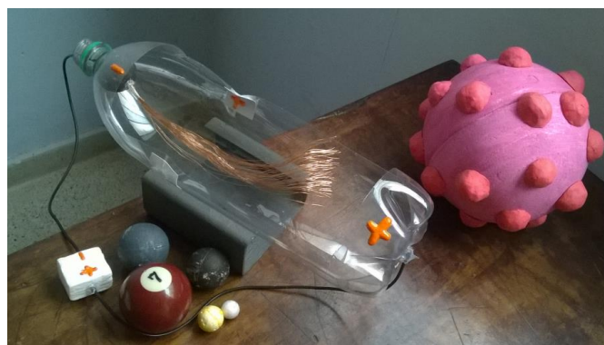
Figura 02: Foto dos materiais táteis desenvolvidos para explicação dos modelos atômicos de Dalton e Thomson.

O material e o experimento em si são novamente explicados para que o aluno pudesse agora tatear a representação do tubo de Crookes e compreendê-lo. Nesse material, feito de garrafa PET, os raios (feixes luminosos) são representados por fios metalizados, que possuem um desvio para um lado específico do tubo, demarcado por uma carga positiva. Discute-se com respeito à distribuição das cargas elétricas na estrutura atômica, que se iniciou no modelo atômico proposto por Thomson. Um material, que se resume em uma bola de isopor esférica rodeada de semiesferas feitas de massinha de modelar, é entregue para que o cego pudesse desenvolver uma impressão tátil daquele modelo. Figura 02.