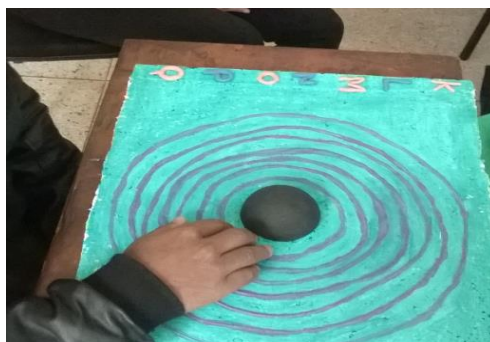
Figura 05: Material confeccionado para dar suporte às explicações referentes aos níveis de energia atômica e transição eletrônica.

Uma inquietante questão de pesquisa de muitos químicos contemporâneos de Pauling era tentar explicar como os elétrons se distribuía ao redor dos átomos. Para Pauling, a distribuição eletrônica era mais que apenas uma ocupação pelos elétrons dos espaços vazios nas camadas da eletrosfera. Segundo sua teoria, os elétrons se distribuem de acordo com o nível de energia de cada subnível, numa sequência crescente ocupando primeiro os subníveis de menor energia e, por último, os de maior (Ramos, et al., 2008). Todo esse respaldo teórico foi primeiramente desenvolvido com o cego para que pudéssemos posteriormente nos debruçarmos na leitura conceitual e procedimental do diagrama em si.