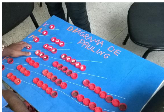
Figura 06: Tradução tátil do diagrama de distribuição eletrônica de Linus Pauling e o aprendiz cego executando a distribuição de alguns elétrons.

Trabalhamos com o cego o fato de que em cada orbital (representado pela tampinha de PET) é possível encontrarmos no máximo 2 elétrons, onde considera-se que um elétron gira em sentido horário enquanto o outro elétron em um sentido anti-horário, o que chamamos de spin eletrônico. Por isso, cada tampinha comporta no máximo até dois elétrons. Ainda foi necessário ensinarmos que os elétrons são adicionados nos subníveis primeiramente de forma paralela, ou seja, todos com o mesmo spin. Por isso os orbitais são preenchidos elétron a elétron (nunca adicionando dois elétrons por vez e com mesmo spin no orbital).