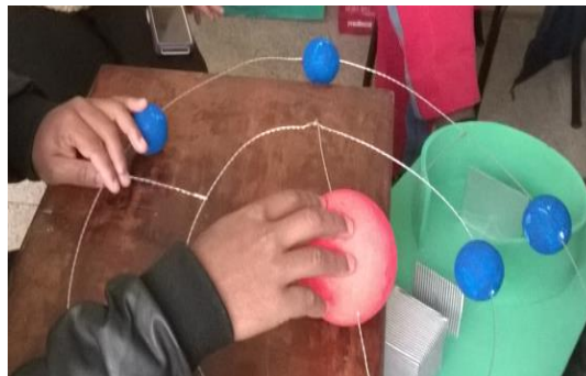
Figura 04: Foto do momento que o aluno cego tateia o modelo concreto de representação do modelo atômico proposto por Rutherford.

O modelo tipo “sistema planetário” foi confeccionado a partir de esferas de isopor, sendo que as de tamanho menores representavam os elétrons, enquanto a maior ao centro representava o núcleo de carga positiva. As órbitas, para dar suporte aos elétrons, foram elaboradas utilizando-se arame, pois se fez necessário para manter os elétrons afastados do núcleo, auxiliando na construção da ideia referente aos elétrons orbitando através de espaços vazios. Uma explicação teórica referente ao caminho, as órbitas, dos elétrons foi realizada, enfatizando que se tratam de orientações imaginárias e não materializadas como estavam no material tátil.