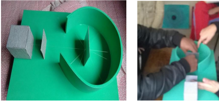
Figura 03: Fotos do modelo tátil de representação do experimento da lâmina de ouro e o momento em que é manuseada pelo aluno cego.