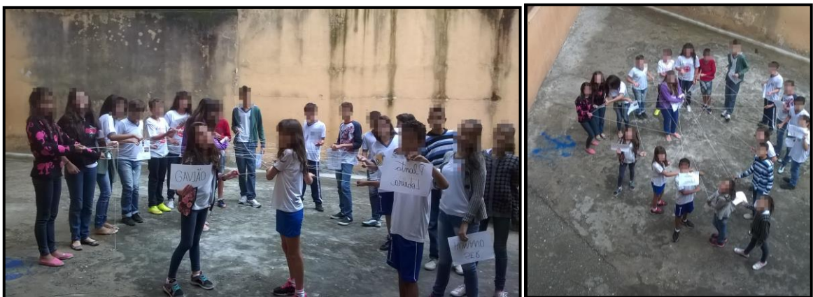
Figura 2: Alunos do 6º ano participando de uma dinâmica sobre cadeia e rede alimentar.

Os alunos participaram de uma dinâmica sobre cadeia e rede alimentar aplicando os conceitos previamente estudados em sala de aula. A dinâmica também foi interessante porque proporcionou aos alunos a realização de uma atividade fora da sala de aula e que ao mesmo tempo envolvesse todos da turma, fortalecendo o sentimento de união e pertencimento do grupo (Fig. 2).