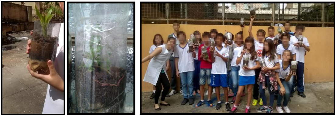
Figura 1: Fotos da atividade prática “Construindo um Terrário”.

As dificuldades relatadas durante a construção do terrário não impediram que estes fossem construídos e que a atividade envolvesse toda a turma (Fig. 1). Na minha percepção foi uma atividade prazerosa em que os alunos tiveram contato com recursos naturais bióticos e abióticos. Uma pergunta interessante que eles fizeram durante esse processo foi “Como nós iremos regar a planta?”. Tanto os alunos quanto a professora expressaram entusiasmo com a atividade.