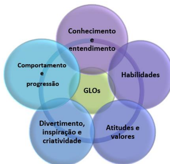
Figura 1: Dimensões de resultados genéricos da aprendizagem.

A proposição do arcabouço interpretativo e metodológico permite diferenciar os resultados das aprendizagens em cinco grandes categorias ou dimensões de aprendizagem, a constar: conhecimento e entendimento; habilidades; atitudes e valores; divertimento, inspiração e criatividade; comportamento e progressão, demonstradas na figura 1: